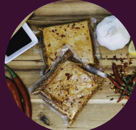
Sweet & Sour